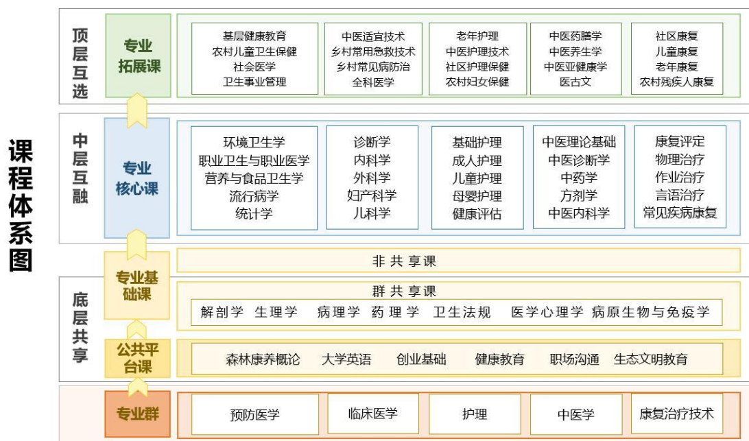
图1 专业群课程体系图

健康服务业以医疗护理为依托，以康复疗养为手段，以预防保健为目的，通过医护人员在基层不同工作领域中“护疗康防”的全程服务，使患者恢复健康，并持续促进健康、保障健康。专业群以专业岗位核心能力和健康服务新业态、新标准（规范）、新产品、新设备为重点，重构并优化“专业基础平台+岗位核心能力+拓展能力”的专业群模块化课程体系（见图1），积极开发面向基层和乡村的特色拓展课程模块，以适应基层健康服务新业态的需求。