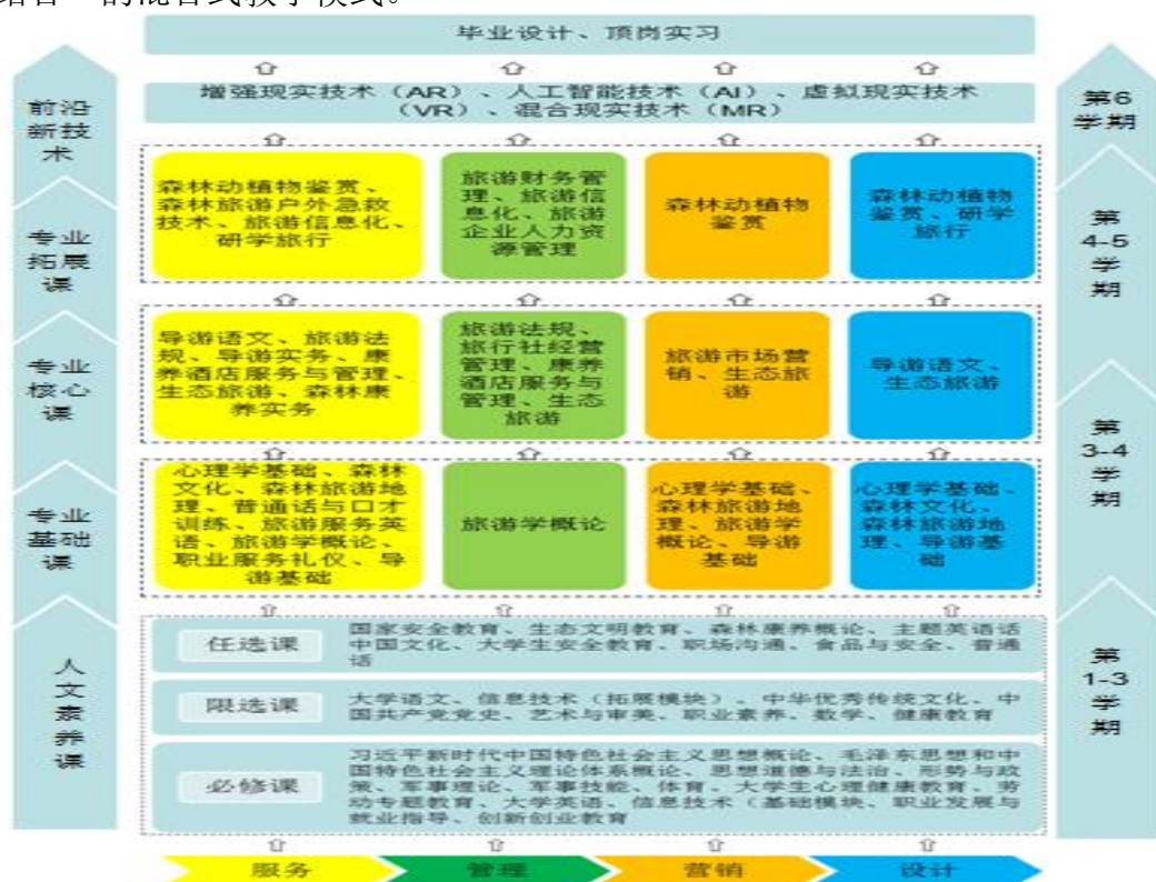
图7 森林生态旅游与康养专业课程体系与学习进阶通道

学校、企业行业、科研机构三方共建共享共用共推专业教学资源库，通过岗位能力解构重组，构建集“服务、管理、营销、设计”为一体的课程体系与“人文素养→基础能力→核心能力→拓展能力→前沿新技术”的学习进阶通道(图6)，从而重构课程教学、技能提升与职业培训内容，搭建“课程超市”、设置“技能模块”、组建“能力链条”，建成能满足专业教育、职业培训、社会服务3个层面课程教学、岗位培训、能力提升的教学资源库，破解教学资源库的建设应用推广困境，实现职业能力“全链条”整合。森林生态旅游与康养专业教学过程均使用该资源库进行，均采用“学生课前线上自学+教师线下课堂教学+教师课后辅导相结合”的混合式教学模式。