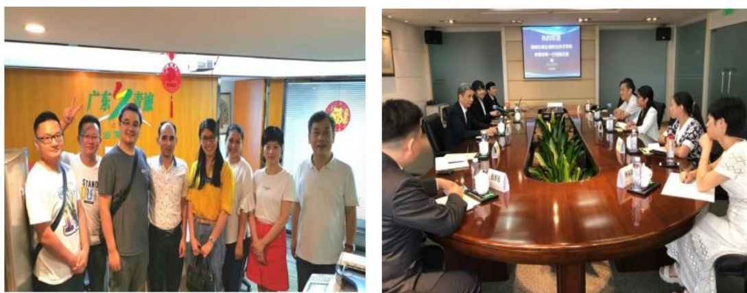
图2 教师与企业管理人员组建课程团队