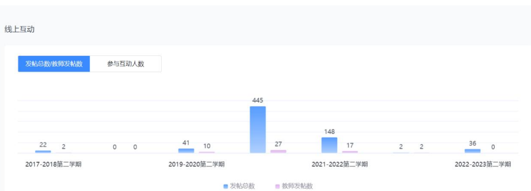
图 15 线上互动情况