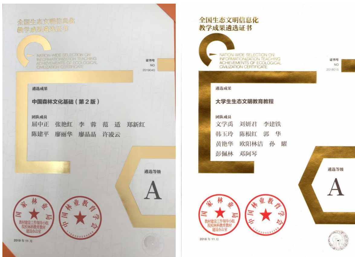
图6 全国生态文明信息化教学成果证书

在专业建设方面，依托森林生态旅游专业，获批国家乡村振兴人才培养优质校、国家级现代学徒制试点专业、省级教育教学改革专业、省级教学团队1个、国家林草局精品课程1门，校企合作开发教材20部。在人才培养方面，获国家林草局教学成果奖A等奖1项、B等奖1项、C等奖1项(图5)。