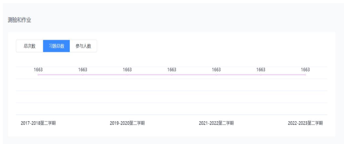
图 17 《导游实务》课程习题总数

每门课程习题数为课时的 6 倍以上(涉及教务处期末抽考的课程，习题数应为课时的 8 倍以上)。《导游实务》课程习题总数达到 1663 道，是可是总数的将近 15 倍（图 17），所有习题全部上传资源库平台，在教学实施过程以作业测验、分组测验或考试的形式向学生发布（图 18），每 6 个课时必须发布一次作业测验(测验若全为客观题，则题量不得少于 10 个)，在课程学习结束时须安排一次线上课程终结考试(作业测验与考试的主、客题型分值应为 1: 1 比例)。每次发布测验、考试均要设置完整的、符合考试要求的起止时间，真正起到检验学生线上学习效果的作用。